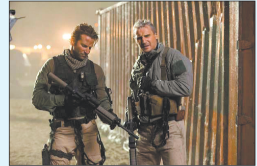
לא ממש נכנסים לנעלי המקור. צוות לעניין

צוות לעניין/ בימוי: ג'ו קרנהאן/ ארה"ב 2010, 117 דקות